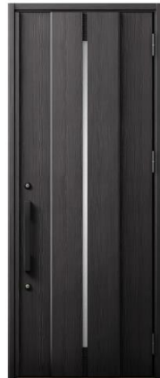
BC:トリノパイン S型ハンドル