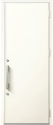
FW:ナチュラルホワイト S型ハンドル