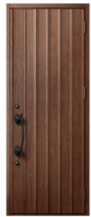
CJ:ポートマホガニー S型ハンドル