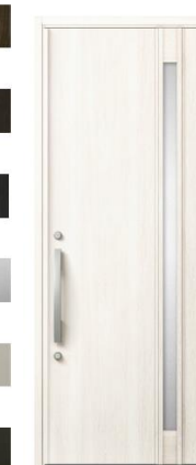
EH:クリエアイボリー S型ハンドル