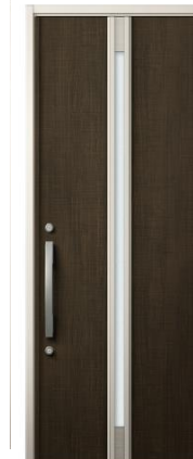
BE:ゼンオーク S型ハンドル