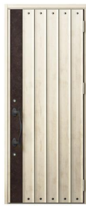
EA:エクリュアイボリー S型ハンドル