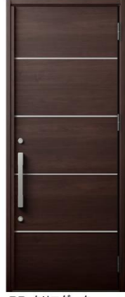
BB:クリエダーク S型ハンドル