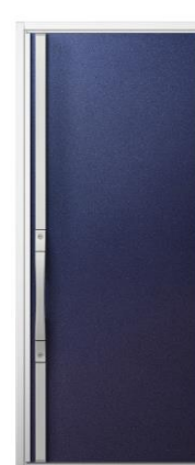
FD:パールブルー S型ハンドル