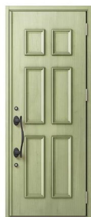
EF:リーフグリーン S型ハンドル