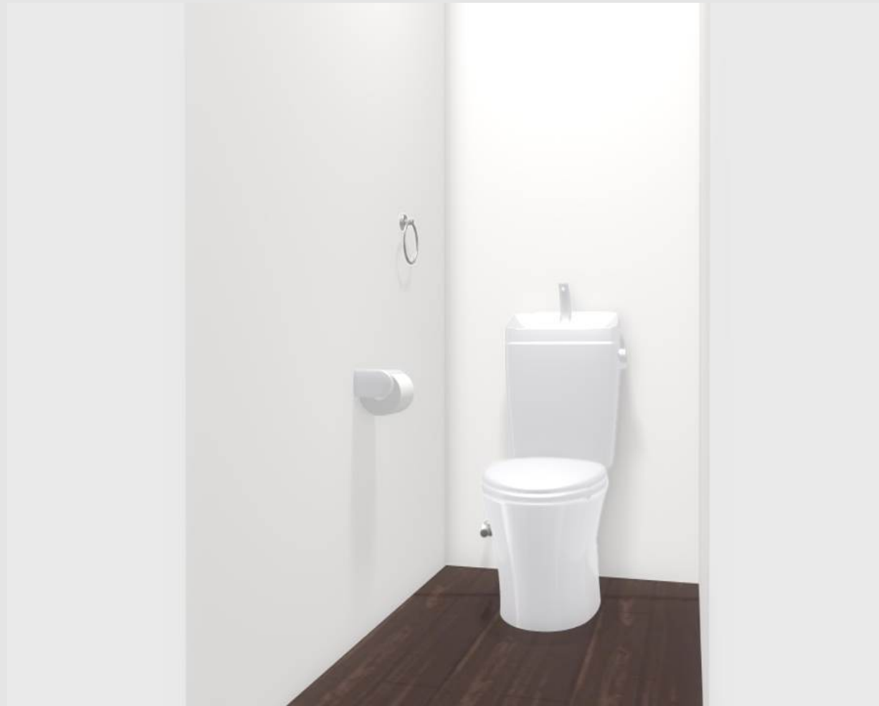
3DCGによるイメージ画像です。 反対壁に設置されている商品がある場合は表示されておりません。