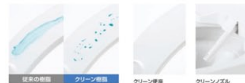
特許 5459514 クリーン便座・クリーンノズル

便座・ノズル・ケースの素材に防汚効果の高い樹脂を採用。さっとひとふきでお手入れ完了。